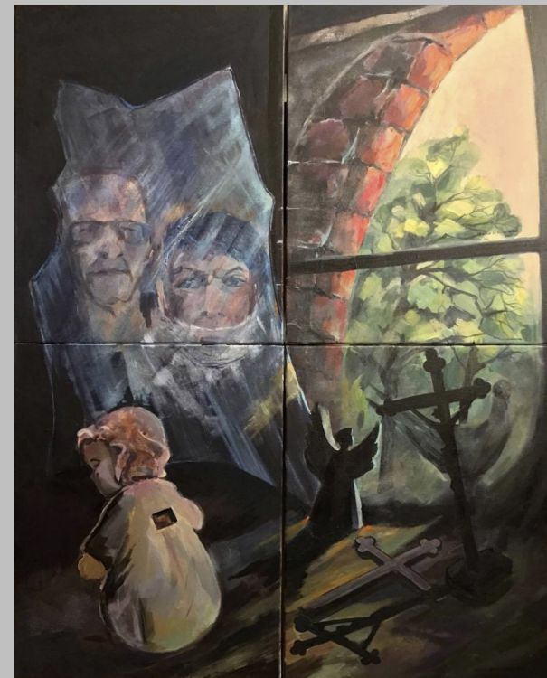
„Jedynie mgnienie oddziela jest od było, będzie ...nieprzeniknione” - akryl, tetrptyk 4 x 50x40cm, Urszula Serafin-Noga

nauczyciel dyplomowany plastyki, muzyki i języka angielskiego uprawia malarstwo olejne, akwarelę, pastel, grafikę, rysunek i fotografię członek ZPAP - PSU oddz. w Opolu, SWPW oddz. w Opolu, formacji artystycznej Cztery na Cztery i Chóru na obcasach