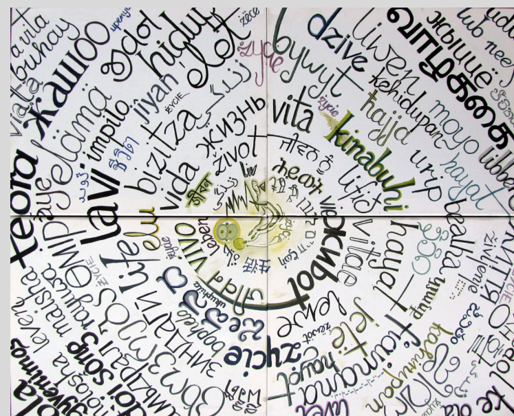
"Było jest i będzie....życie" -olej, tetrptyk 4 x 40x50 cm, Małgorzata Wojdyło

członek ZPAP - PSU oddz. w Opolu, SWPW oddz. w Opolu oraz formacji artystycznej Cztery na Cztery